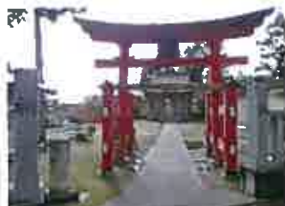
石動神社(小古津新)