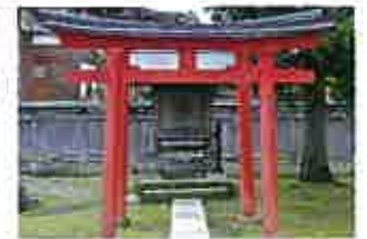
稲荷神社(灰方)四社宮境内