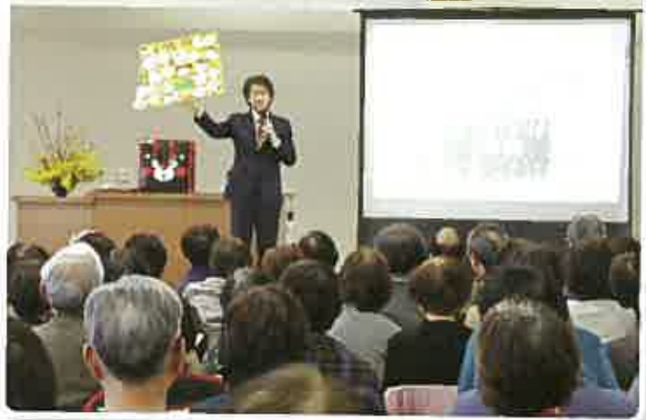
田地区まちづくり協議会