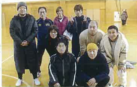
優勝の小高チーム