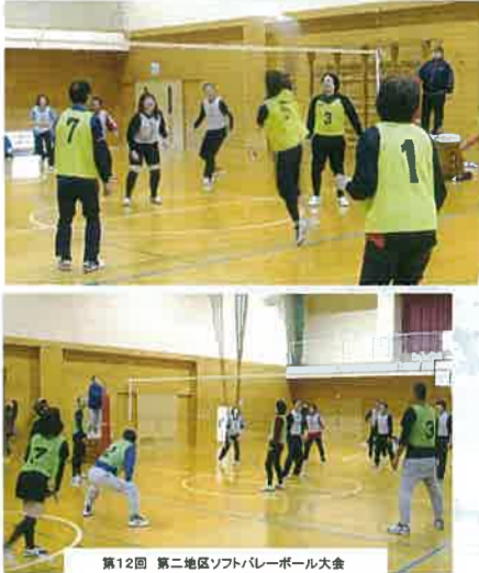
第12回 第二地区ソフトバレーボール大会

開催まで体育委員、地域の代表者の方は毎年、人集めと連絡にご苦労されていた様です。今年は南4丁目を除く14地区、約200名の方に参加して頂きました。各地域を回りながら申し訳ないという気持ちもありましたが、地域をとりまとめて頂いた方と、その呼びかけに応じて参加して頂いた皆様には本当に感謝致します。会場設営や慣れない審判等も行つて頂きありがとうございました。今年も中学生から七十代まで幅広い年代が集まり声を掛け合い動き回り試合と時間を共有する面白みは何度経験してもワクワクするものでした。交流と親睦を目的とした大会ですが町内対抗となれば熱くなり得点が入ると歓声を上げて盛り上がり、ミスをして仲間同士、笑い飛ばして健闘をたたえあう光景は勝つても負けても慰労会でも楽しめる十二月の良い思い出の一日になったと思います。結果は六月のソフトボール大会でも優勝した小高チームが4年ぶりに五回目の優勝を果たしました。