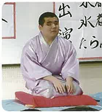
▲たらふく亭美豚くん