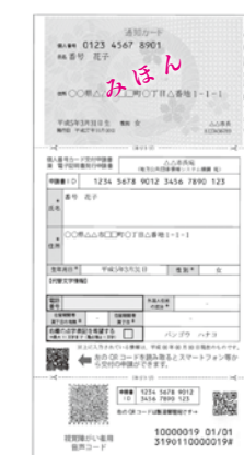
交付申請書の見本