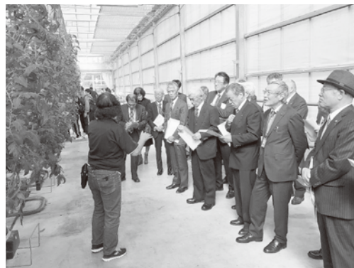
▲(株)ワンダーファームの視察

(株)ワンダーファームは、国内の農業情勢や日本人の食生活が大きく様変わりする中で、単に農産物を作って売だけでなく「自分たちで作って付加価値を高めて売る」という6次産業化の先駆けとして平成25年に設立。「五感を耕す、農と食の体験」をコンセプトに、地元食材を味わえる複合型農業のテーマパークです。原発事故後の県産食材のイメージ改善や交流人口の増加、雇用の創出を目指した事業は復興特区の拠点、地方創出のモデルとなっています。