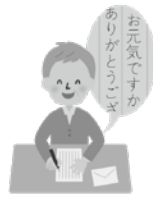
図 社会教育課 公民館事業係（中央公民館内）☎ 0256・63・7001