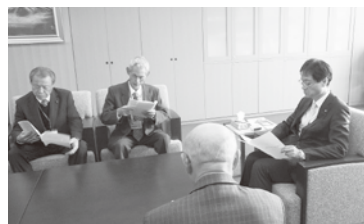
◀市長に意見書を 提出する委員

意見書では、農地中間管理事業の見直しに伴う「人・農地プラン」の実質化に向けた積極的な取組みや遊休農地の発生防止など、今後の燕市農業の発展に向けた予算措置や仕組みづくり、関係機関への働きかけを要請しました。