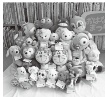
お気に入りのぬいぐるみの素敵な思い出づくりにいかがですか。