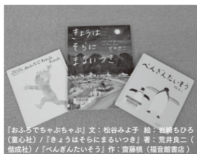
赤ちゃんが自然と笑顔になる！そんな絵本を紹介します。

忙しいお父さんお母さんも安心！図書館で本を選んでいる時間がないという人に、オススメ赤ちゃん絵本3冊をセットにして貸し出します。 ●開始時期 4月1日