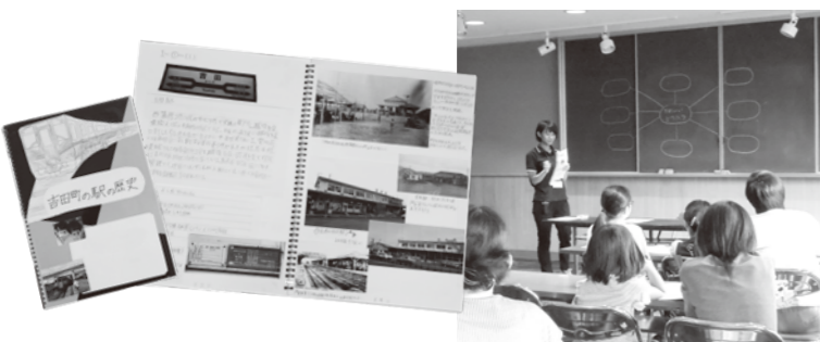
令和元年度の最優秀作品（写真左）。夏休みは小学生の（親も？）悩みの種の自由研究をサポート（写真右）。

図書館にある資料をはじめ、さまざまな情報を活用することは、子どもの「自ら考え、判断し、表現する力」を育みます。夏休みには「調べる学習さばー」と教室を開催。自由研究にも活用できます。 困ったときは、調べるプロの図書館職員がサポート。図書館は子どもたちの探究心を応援します！