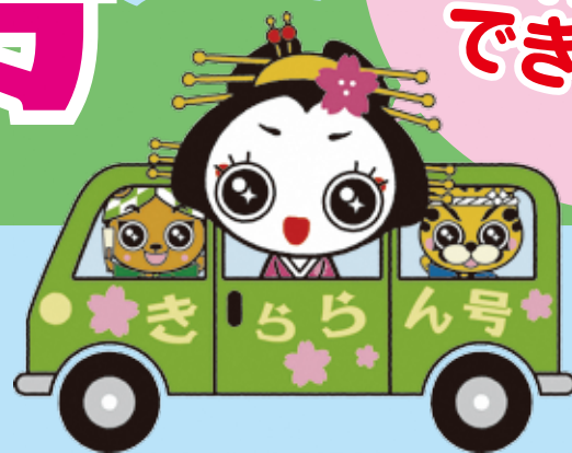
▲燕市観光 PR キャラクター「きららん」