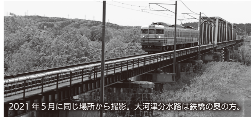
2021年5月に同じ場所から撮影。大河津分水路は鉄橋の奥の方。

7月4日(日)、大雨による大河津分水路・信濃川の水位上昇を想定した防災訓練を行います。訓練の前にマイ・タイムラインを作成しておき、訓練当日には各家庭で災害時の避難行動を実践しましょう。