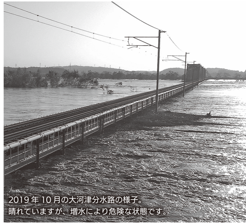
2019年10月の大河津分水路の様子。晴れていますが、増水により危険な状態です。