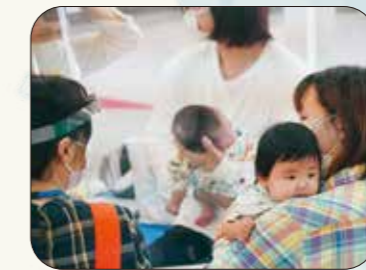
▲2か月児育児相談会の様子

相談会参加者の声 小さな悩みでも親身になって聞いてくれて、とても助かっています。ママ同士も仲良くなれる交流の場です。