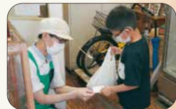
協賛企業：ホームベーカリー 中村屋

ママたちが互いの悩み事や困り事について話し合い、自身に合った子育ての方法について学びます（対象：1～3歳のお子さんの保護者）。