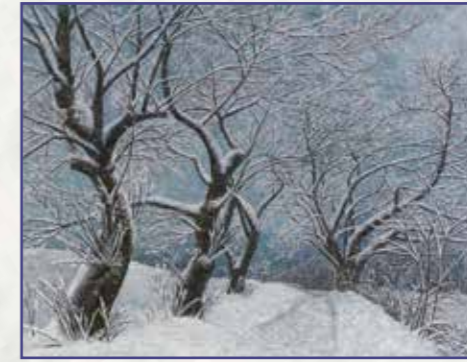
「ゆきがかりの小径」 やまみや りな 山宮 里菜（小池新町）