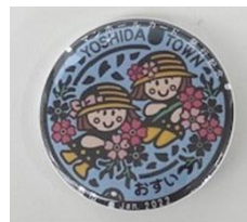
◀長善館史料館 入館特典の缶バッジ

デザインは、旧吉田町のマスコットキャラクター「バーベナちゃん」が町の花「バーベナテネラ」を手に春の訪れを喜んでいる様子が描かれています。