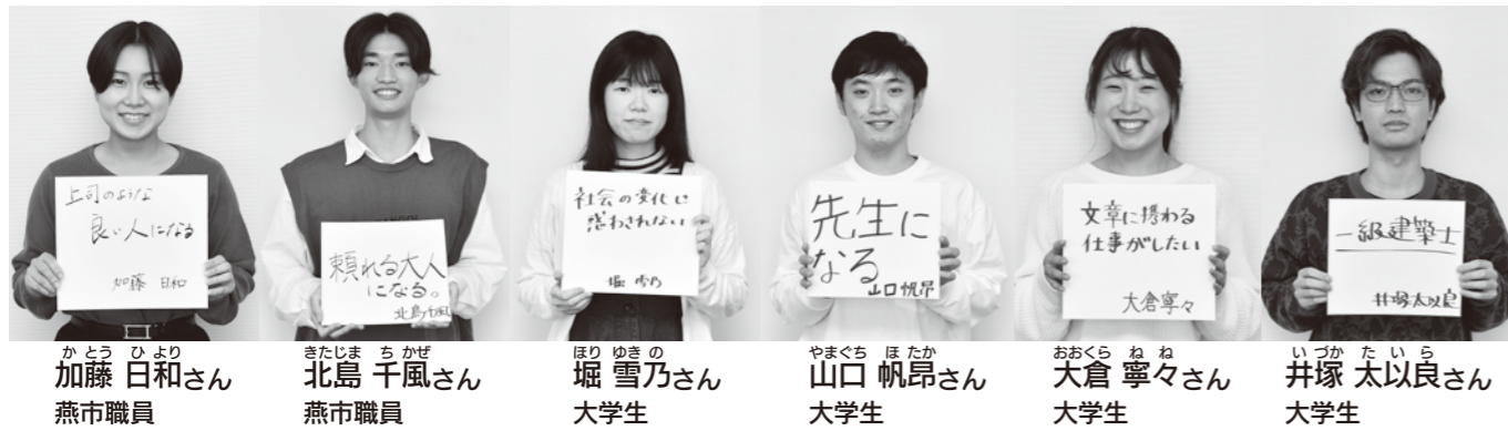
※この座談会は昨年11月20日に開催しました。