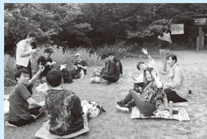
▲頂上カップ麺チャレンジ。熱湯を入れた水筒を持って、国上山登山を敢行。無事山頂に到達し、みんなでおいしくカップ麺をいただきました。

燕ジョイ活動部は、自由な発想で話し合い、メンバー自らが感じたことを楽しみながら、さまざまなアクションを企画し、実行していくプロジェクトです。メンバーは29歳まで。「自由でいいんです。」を合言葉に、みんなで活動しています！