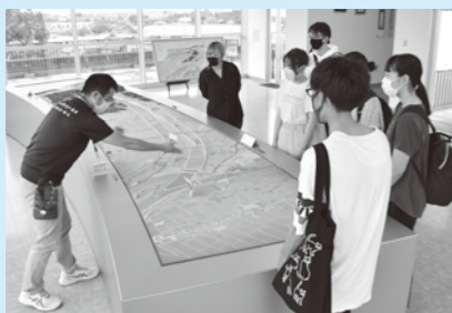
▲大河津分水通水100周年を前に「大河津分水Twitter川柳コンテスト」をメンバーが企画。作品の選考会に向けて、自らも学ぼうと大河津資料館を見学し、その周辺を散策しました。