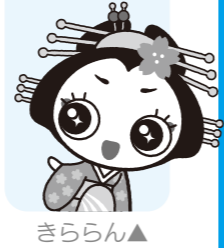
燕市観光協会 YouTubeチャンネルで生配信も行います！

7 大河津分水堰 特別ライトアップ 大河津分水の水量調整の役割を担う洗堰と可動堰。貴重なライトアップは必見です！ 4月4日(月)～17日(日) 午後6時～9時