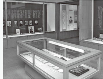
▲定期的に企画展を開催し、展示物の入れ替えも行っています。