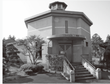
▲長善館史料館。長善館の土蔵があった場所に建てられています。

※長谷川泰が普及に向けて尽力した下水道。その下水道への理解・関心を深めてもらうために配布しているカードです。