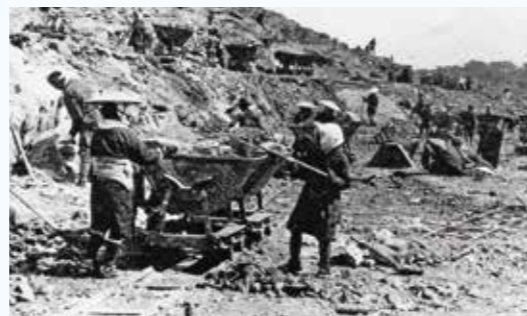
▲大河津分水建設工事の様子

また、工事により運び出された土砂は約 2,880万㎡で、その土砂を積んだダンプカーを 並べると地球を一周する長さになるそうです。