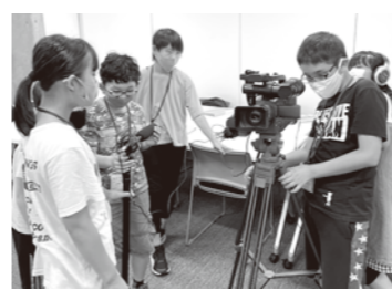
▲動画制作など時代に合わせた方法で学ぶ長善館学習塾。

だが、時代に合わせて日本語や数学、英語も教科として加えていきました。これにより、遠方からも塾生が集まり、一時は門下生が70人を超えるほど隆盛を極めました。