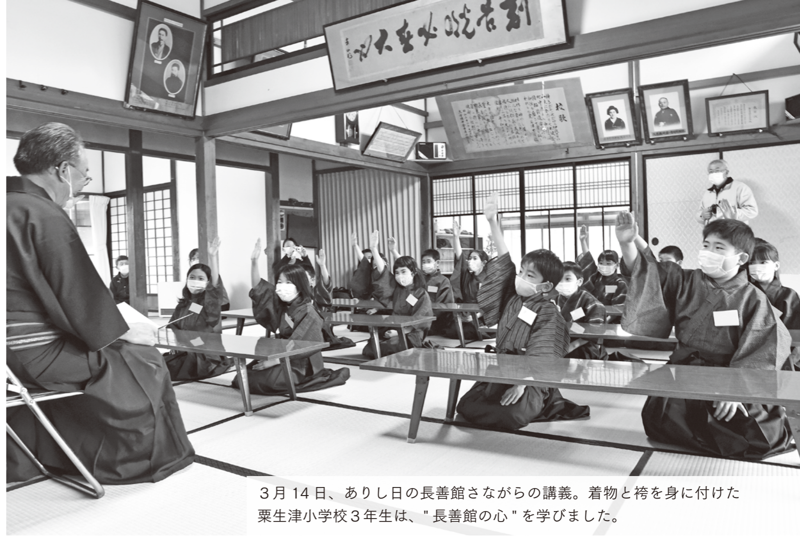
3月14日、ありし日の長善館さながらの講義。着物と袴を身に付けた粟生津小学校3年生は、“長善館の心”を学びました。