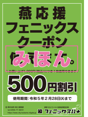
▲使用可能店舗は、グリーン色のポスターが目印です

例 理髪店で4,400円のお会計の場合…4枚使用できます(2,000円割引)。 居酒屋で7,700円のお会計の場合…7枚使用できます(3,500円割引)。 食堂で800円のお会計の場合…1,000円未満のため、1枚も使用できません。