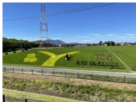
見ごろ時期の様子