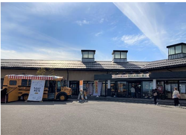
SORAIRO 国上 (道の駅国上)