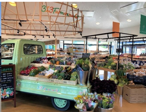
ファーマーズ・マーケット