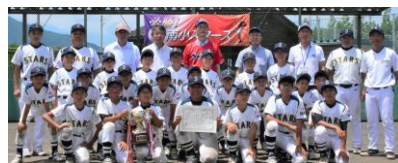
燕市代表チーム 南小スターズ