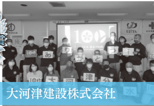
大河津建設株式会社