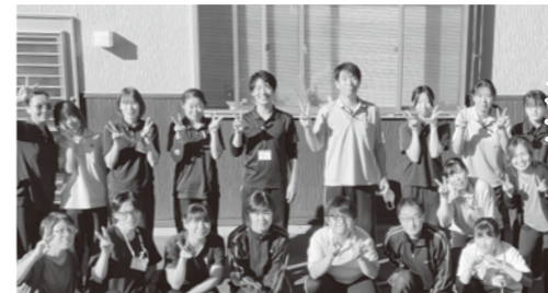
社会福祉法人新潟さくら会 分水いちごの実