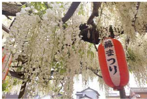
八王寺大白藤 ●5月上旬 安了寺

新潟県の天然記念物に指定されている八王寺の白藤。樹齢約350年と推定されている巨木は、今年も美しい花と甘い匂いで見物客を楽しませました。今年も4年ぶりに「白藤茶会」も開催されました。