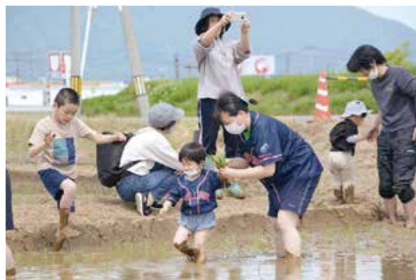
スワローズ・ライスファーム田植え ●5月13日 市役所南側の水田

現在の産業の礎となった鋤起銅器の草創期を支え、燕の名を轟かせてきた名工「伝説の職人」たちの作品を展示。燕市の金属加工産業の原点を学び、触れられる貴重な機会になりました。