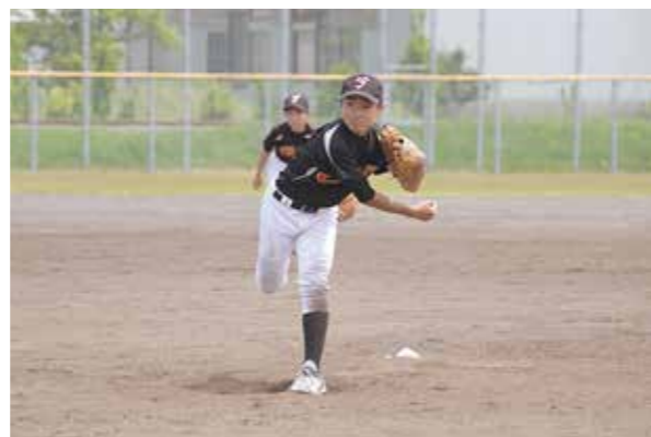
第11回スワローズカップ燕市代表が決定！ ●4月29日 吉田野球場