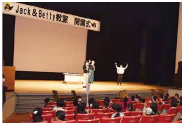
ジャック&ベティ 教室開講式 ●5月13日 燕市文化会館

県外に在住する18～30歳の燕市出身者の交流、応援の場である「つばめいと」。今春から県外での生活をスタートさせた新メンバーを迎えて、先輩メンバーとの交流会を開催しました。