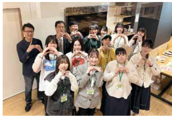
welcome つばめいと ●4月22日 Gate CAFE (東京都)

新潟県の天然記念物に指定されている八王寺の白藤。樹齢約350年と推定されている巨木は、今年も美しい花と甘い匂いで見物客を楽しませました。今年も4年ぶりに「白藤茶会」も開催されました。