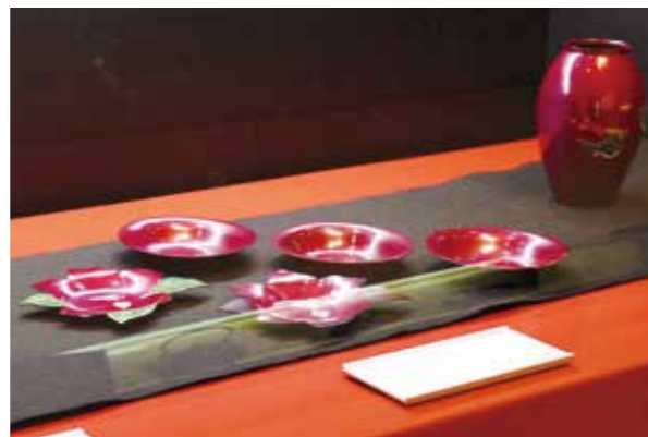
産業史料館企画展「燕 伝説の職人展」 ●4月28日～5月21日 燕市産業史料館

小学生105人、中学生24人が参加するJack&Betty教室。開講式と第1回レッスンが実施され、ほかの学校の友だちや外国人の英語指導助手と楽しく英語のレッスンを受けていました。