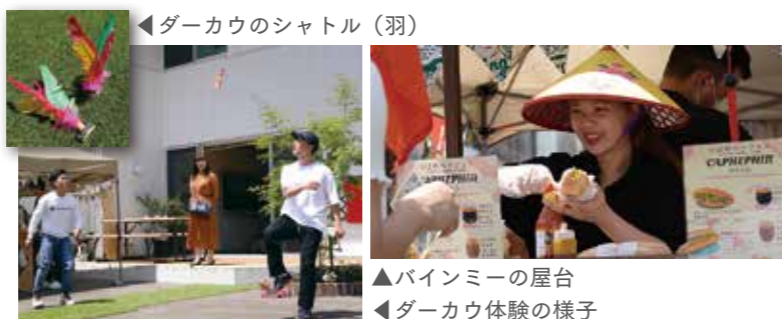
◀ダーカウのシャトル (羽)

5月5日に宮町商店街で、「つばめベトナムフェス」が開催されました。「市内に住むベトナム出身の人たちと仲良くなりたい」と市内有志の皆さんが企画。重りのついたシャトルを足で蹴り合う「ダーカウ」の体験やベトナムのサンドイッチ「バインミー」の屋台も出店し、会場は活気に溢れました。