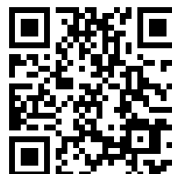
▲笛人チケットオンライン