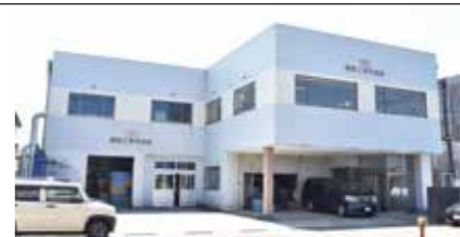
燕器工株式会社 燕市八王寺 1599

30年以上にわたり、プレス加工業としてステンレス、チタン、アルミ製品の企画・開発の段階から製造まで請け負っている。