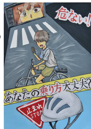
令和5年度 燕市長賞 受賞作品