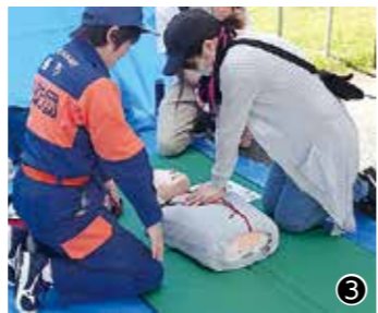
①方面隊訓練（放水） ②水防訓練（土嚢積み） ③救急救命講習