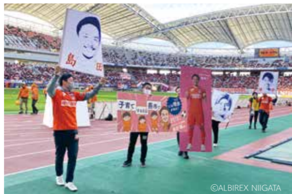
アルビレックス新潟「市町村デー」でPR! ● 11月11日 デンカビッグスワンスタジアム

大河津分水に感謝し、親しみ、理解を深めてもらうイベント「大河津分水サンクスフェスタ」を開催。ラジオパーソナリティーのトークライブやワークショップが行われ、来場者は大河津分水で楽しいひと時を過ごしました。