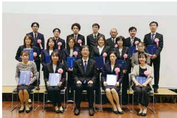
次世代を担うキャリアアテン介護職員等表彰式 ● 11月9日、10日 燕市役所

愛犬といっしょにSORAIRO 国上を楽しめるドッグランが誕生しました。また、燕市の三つ星給食メニュー「トマミソカレー豚丼」と燕市役所まちあそび部考案の「燕背脂ラーメンおにぎり」の販売も開始されました。