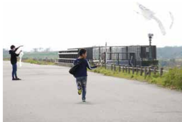
大河津分水に感謝をする一日 ● 11月5日 信濃川大河津資料館・大河津出張所

コロナ禍で4年ぶりの開催となった200メートルいちび。ツバメルシェとタイアップして行われました。雨にもかかわらず、ハロウィンにちなんだイベントなどもあり、多くの家族連れで賑わいを見せていました。