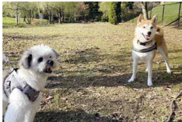
SORAIRO 国上に新たな魅力が追加! ● 11月1日から開始 道の駅SORAIRO 国上

11月1日に発行した『広報つばめ 子ども版』。制作にあたった子ども記者12期生の終了式を開催しました。式では取材先の人や記者の家族も同席し、編集で工夫した点や苦勞したところなどを発表しました。