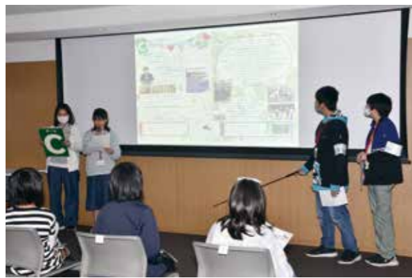
『広報つばめ』子ども記者終了式 ● 10月25日 燕市役所

11月1日に発行した『広報つばめ 子ども版』。制作にあたった子ども記者12期生の終了式を開催しました。式では取材先の人や記者の家族も同席し、編集で工夫した点や苦勞したところなどを発表しました。