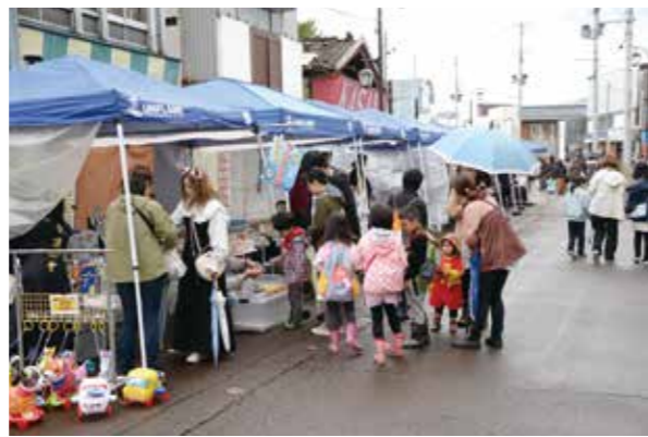
ツバメルシェ with 200メートルいちび ● 10月29日 穀町・宮町・仲町・秋葉町地内

通算10年以上勤務している介護職員等に感謝と敬意を表する表彰式が行われました。対象の皆さんが表彰式に参加いただけるよう2日間にかけて実施し、今年は57人を表彰しました。