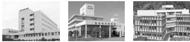
県立吉田病院 済生会三条病院 県立加茂病院