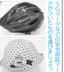
問 生活環境課 交通安全・防犯係 ☎ 0256・77・8162

自転車のヘルメットは、機能性やデザイン性に優れたさまざまなタイプのものが販売されています。ヘルメットを所有していない人は、自分に合ったヘルメットを購入し、着用の準備をお願いします。