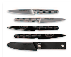
準グランプリ 【経済産業省製造産業局長賞】 GLOBAL CAMP 吉田金属工業(株)