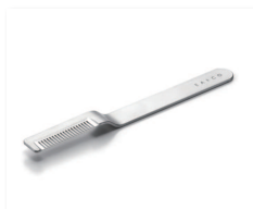
準グランプリ 【中小企業庁長官賞】 EATCO Saku (株)ヨシカワ