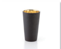
優秀賞 【関東経済産業局長賞】 漆磨ストリートタンブラー 麗・赤 (株)タマハシ ◎その他審査委員特別賞 7点

【経済産業大臣賞】 HOVERLIGHT SPORK (有)アイデアセキカワ 48回目を迎えた今年は、31社46点の出品がありました。審査基準は新規・革新性、デザイン性、機能性、市場性、社会・環境性の5点。 グランプリは有限会社アイデアセキカワの「HOVERLIGHT SPORK」世界で最も軽い金属製カトラリーへの挑戦をテーマに製作。シドニー・オペラハウスでも採用されているシェール構造とハードアルマイトを組み合わせ、金属の厚さの限界を打ち破り、実用性に優れた軽量性と強度を兼ね備えた製品です。