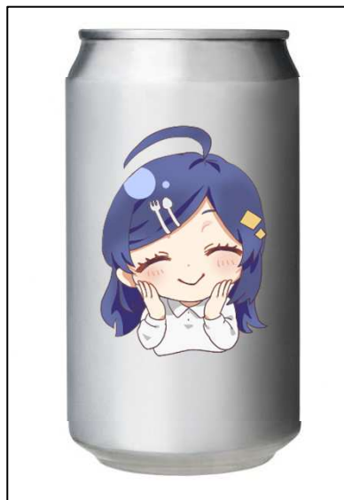
〈 パッケージ 〉

どのような商品になるかがわかる完成品の見本またはデザイン案や設計図及び素材サンプルを提出