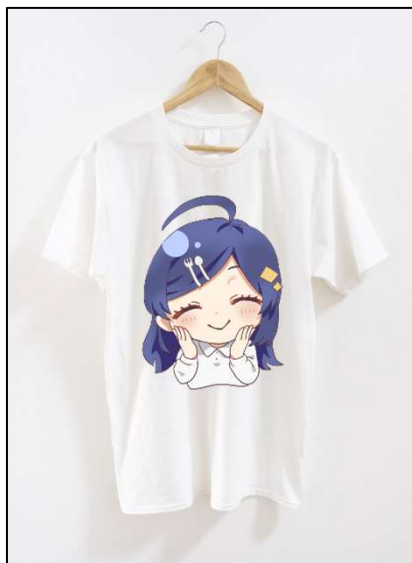
〈 商品 〉

利用承認申請書には、完成品の見本(現物または、その写真、デザイン案及び商品の仕様書など、) 桜咲ユメをどのように利用するか具体的にわかるものが必要です。