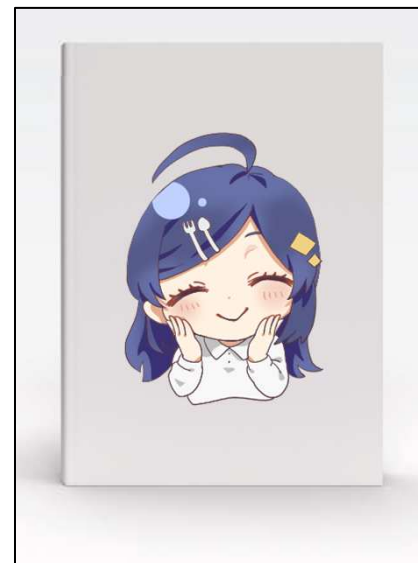
〈 印刷物 〉

どこに、どのようなサイズ・色で使うかが分かるデザイン案を提出 シールを貼る場合はシールデザインを貼る位置を示した商品の画像を提出