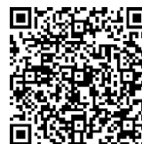
▲市公式ホームページ