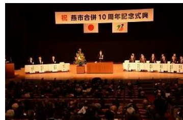
▲合併 10 周年記念式典の様子

国歌斉唱、式辞（燕市長）、挨拶（燕市議会議長） 来賓祝辞、来賓紹介、20 年の振り返り映像上映、 市民憲章朗読（20 歳を迎える皆さん・代表者）等