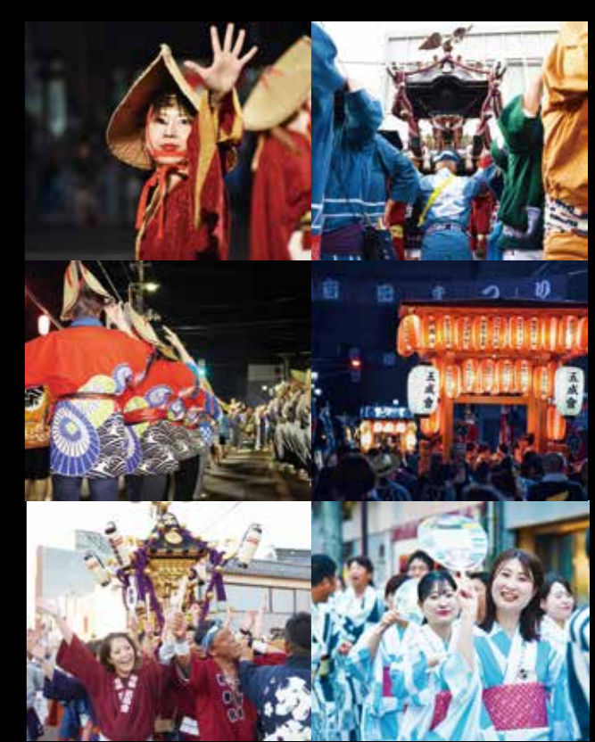
昨年度の各地区の夏まつりの様子 ▲