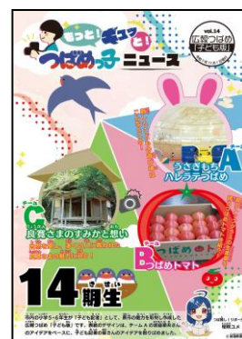
▲広報つばめ子ども版 (令和 7 年度発行)

※紙面の都合で書ききれない取材内容をまとめた 活動記録動画を YouTube で公開予定