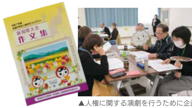
▲人権に関する演劇を行うために企画しています。

さらに、「命の大切さ」を作文や植物などの身近なものから感じてもらえるように、全国中学生人権作文コンテストや花植え体験などの企画を練っています。少しでも人権について考える機会を設けることも重要な取り組みです。「こんな講演をしてほしい」「こんな企画をしてほしい」といった希望がありましたら、ぜひお声かけください。