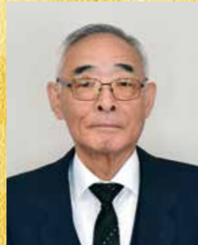
瑞宝双光章 (警察功勞)