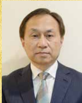
瑞宝小綬章 (教育功勞)