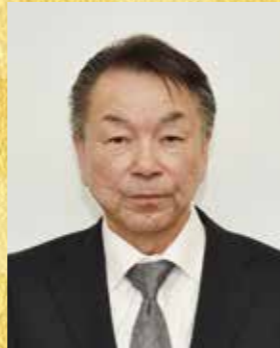
瑞宝双光章 (消防功勞)