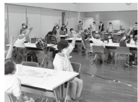
過去のイベントの様子▼

申 6月25日(休)までに電話にて ☎ 長寿福祉課 地域支援相談チーム ☎ 77・8157