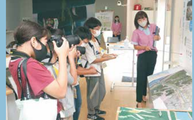
子どもたちが取材・編集をして「広報つばめ子ども版」を作成し、つばめの魅力をたくさんの人に知ってもらうために活動します。