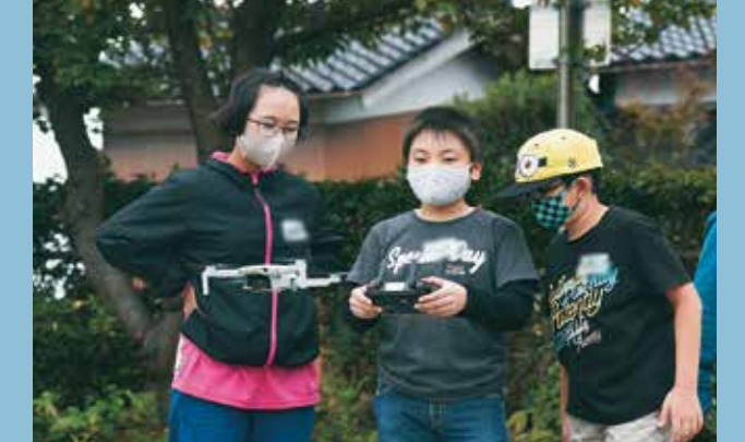
さまざまな活動を通して、リーダーとしての資質を養い、未来の燕市を担う子どもたちを育成します（今年度はドローン操縦教室）。