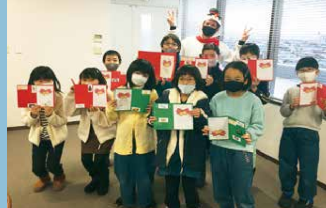
英語での活動やコミュニケーションを通じて、世界で活躍するために必要不可欠な協調性やリーダーシップの力を伸ばします。