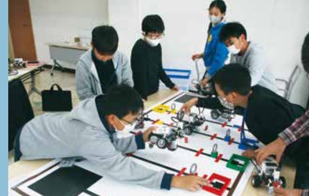
プログラミングを試行錯誤しながらロボットを動かすことで、論理的に考える力や物事に根気強く取り組む態度を高めます。