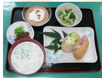
生涯骨太クッキングより