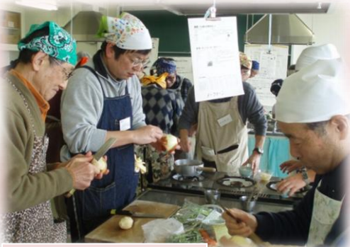
昨年度の男性料理教室の様子