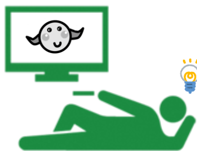
テレビを見ながら

運動はしたいけれど、長続きしない…そんなあなたに朗報！ ちょっとした工夫で、日常生活がそのまま運動になる極意をお伝えします。