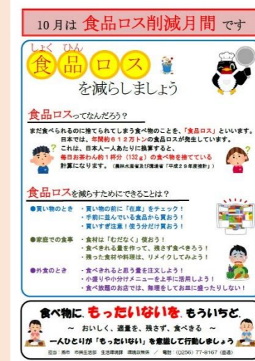
食品ロス削減ポスター