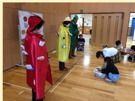
児童館での食育 三色バランス隊