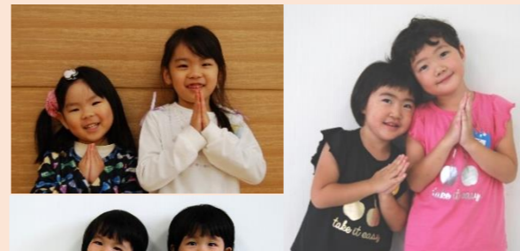
広報つばめいただきますの顔掲載