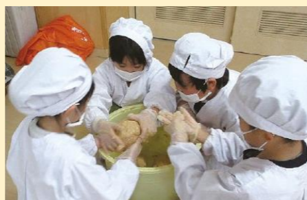
つばめキッズファーム事業