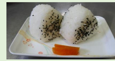
道の駅国上にて販売 燕市産米おにぎり