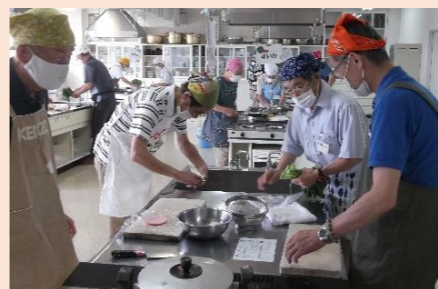
元気磨きたい男のチューボーPJ