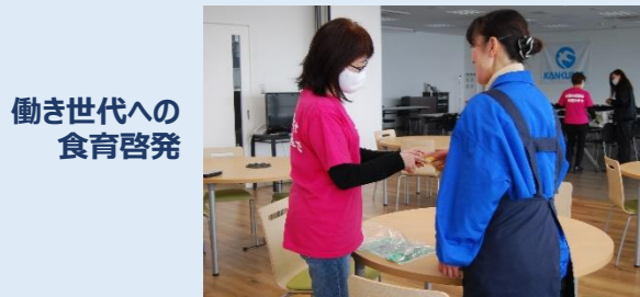
働き世代への食育啓発