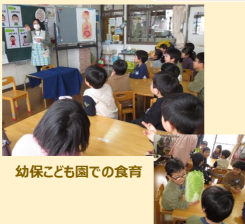
幼保こども園での食育