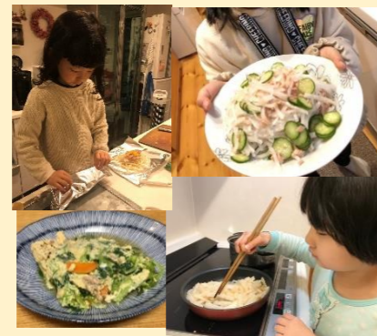
けんこうづくりチャレンジ企画