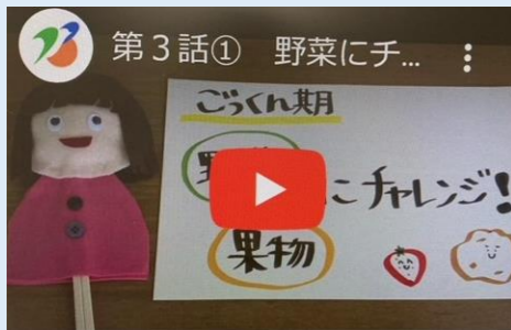
離乳食動画配信開始