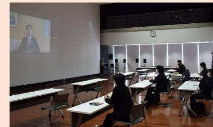
女性活躍推進フォーラム