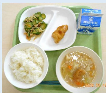
学校給食減塩愛ディア献立