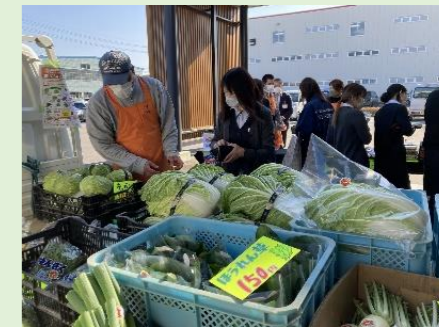
若手農家による農産物直売会