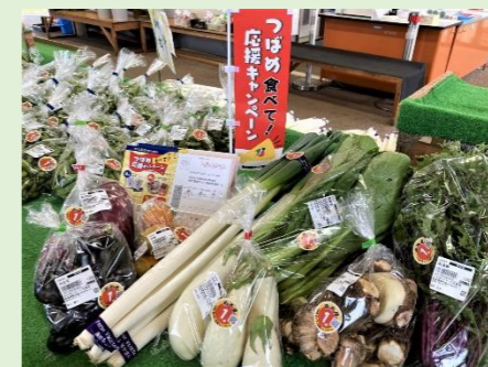
つばめ食べて！応援キャンペーン