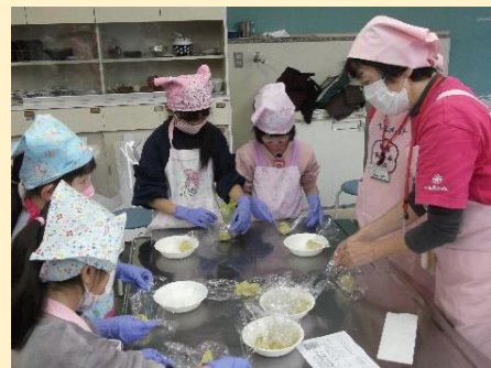
栽培したサツマイモを使って調理