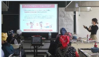
女性防災リーダー養成講座