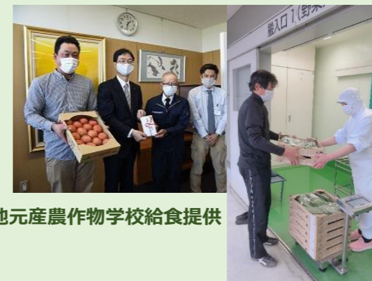
地元産農作物学校給食提供