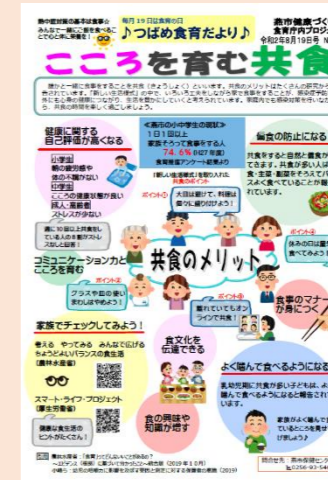
つばめ食育だより「共食のすすめ」