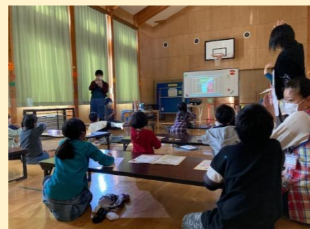
オンラインによる食育講座