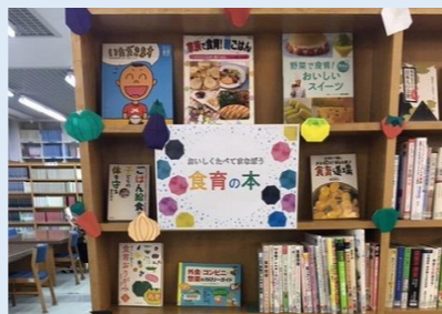
図書館食育の本コーナー設置