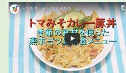
三ツ星給食作り方動画配信