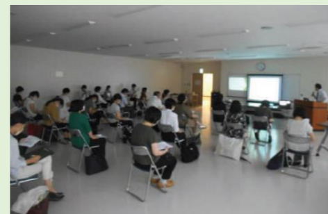
食物アレルギー研修会