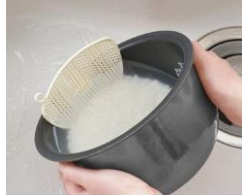
しよつきあらいスポンジ