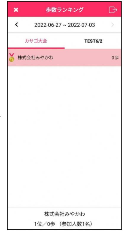
開催中の登録の場合