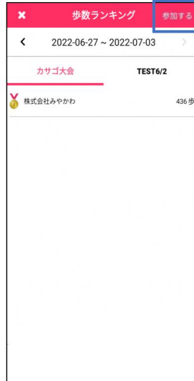
新潟県企業対抗歩数ランキング画面