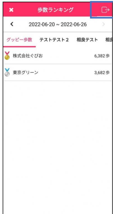
新潟県企業対抗歩数ランキング画面 イベント開催後の画面

期間を継続して異なるイベントに参加する場合には、イベント終了後に離脱操作を行う必要があります。前後のイベントで「参加コード」が異なる可能性もございますので、参加コード入力の際にはご注意ください。