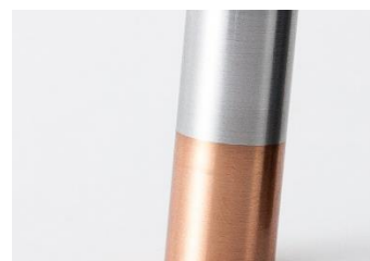
摩擦圧接加工による異素材の溶接