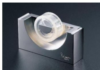
マシニング加工でひとつの金属の塊から削り出したテープカッター

また、製品製作において一括窓口として複数企業を取りまとめ、最終製品を提供する企業でもある為、「ものづくりのまち・燕」の特性ともいえる企業間のつながりにも強い。