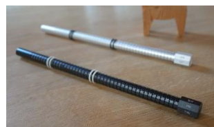
製品化された第1回大賞受賞作品 calen-Bar

また、過去に実施された当コンペティションにおける、受賞作品の製品化実績も3作品持っている。