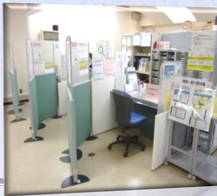
お仕事の相談窓口