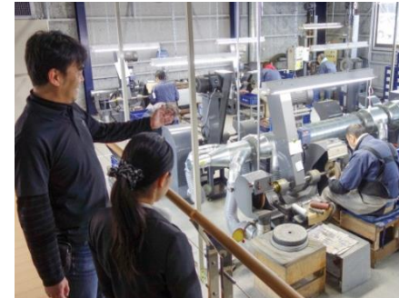
市内企業で進むオープンファクトリー