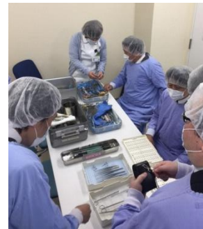
燕市医療機器研究会の活動