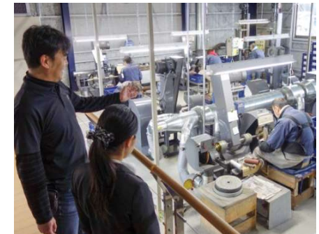
市内企業で進むオープンファクトリー