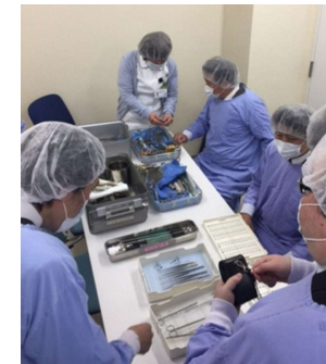
燕市医療機器研究会の活動