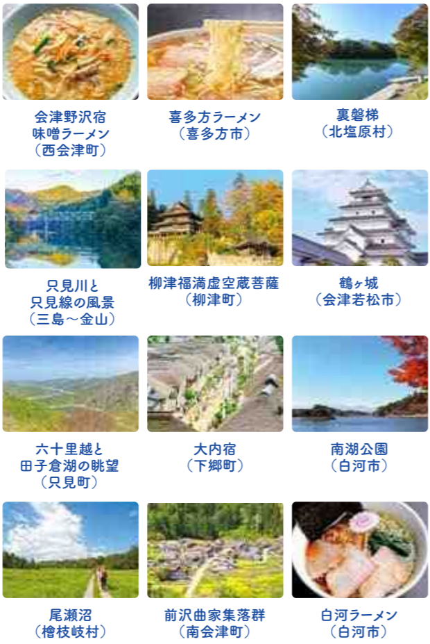
会津野沢宿味噌ラーメン(西会津町) 喜多方ラーメン(喜多方市) 裏磐梯(北塩原村) 只見川と只見線の風景(三島～金山) 柳津福満虚空蔵菩薩(柳津町) 鶴ヶ城(会津若松市) 六十里越と田子倉湖の眺望(只見町) 大内宿(下郷町) 南湖公園(白河市) 尾瀬沼(檜枝岐村) 前沢曲家集落群(南会津町) 白河ラーメン(白河市)