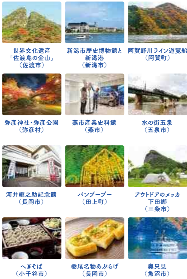
世界文化遺産「佐渡島の金山」(佐渡市) 新潟市歴史博物館と新潟港(新潟市) 阿賀野川ライン遊覧船(阿賀町) 弥彦神社・弥彦公園(弥彦村) 燕市産業史料館(燕市) 水の街五泉(五泉市) 河井継之助記念館(長岡市) バンブーブー(田上町) アウトドアのメッカ 下田郷(三条市) へぎそば(小千谷市) 栃尾名物あぶらげ(長岡市) 奥只見(魚沼市)