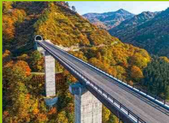
八十里越天空大橋