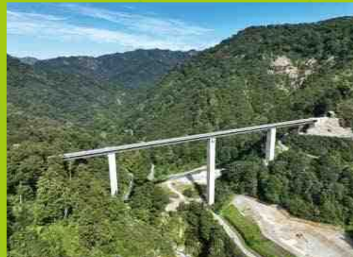
八十里越天空大橋