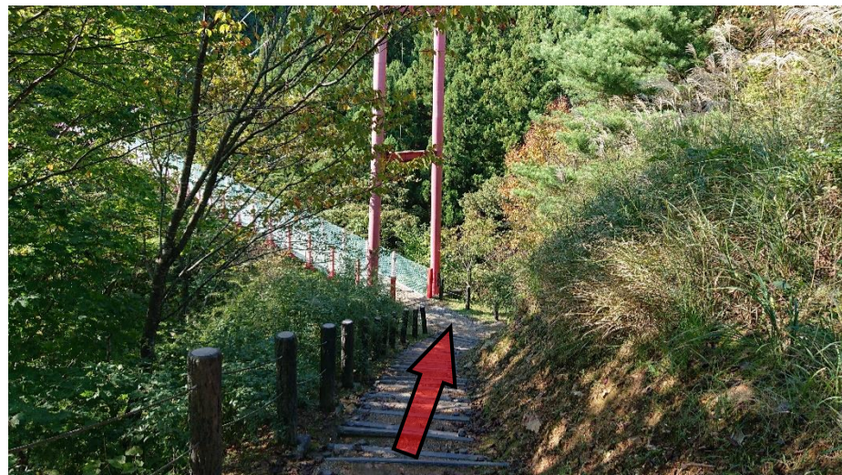
⑥階段を下って千眼堂吊り橋に向かいます。