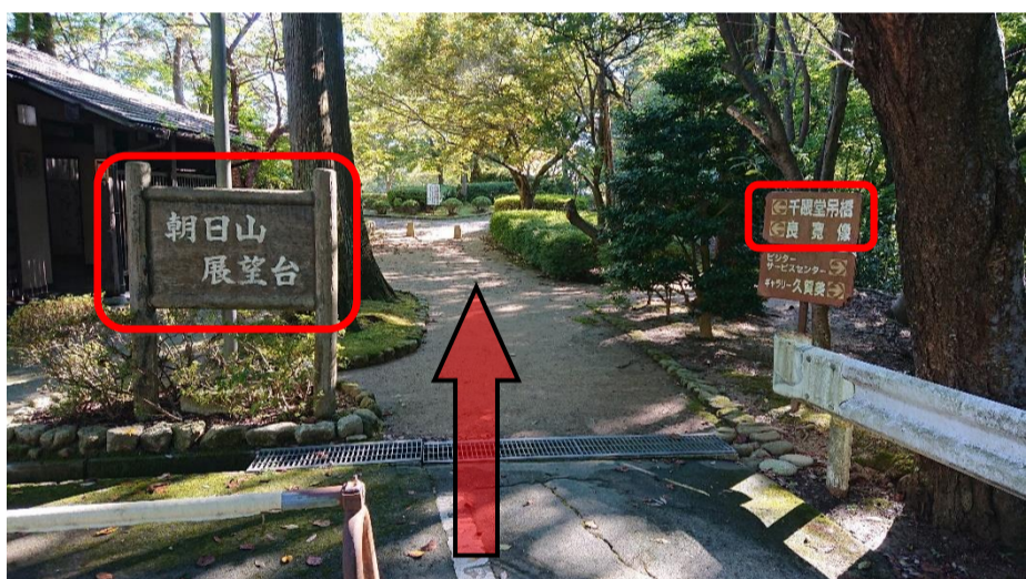
③朝日山展望台に入ります。