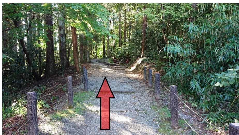
⑧千眼堂吊り橋を渡ったら石畳道階段まで道なりに進みます。