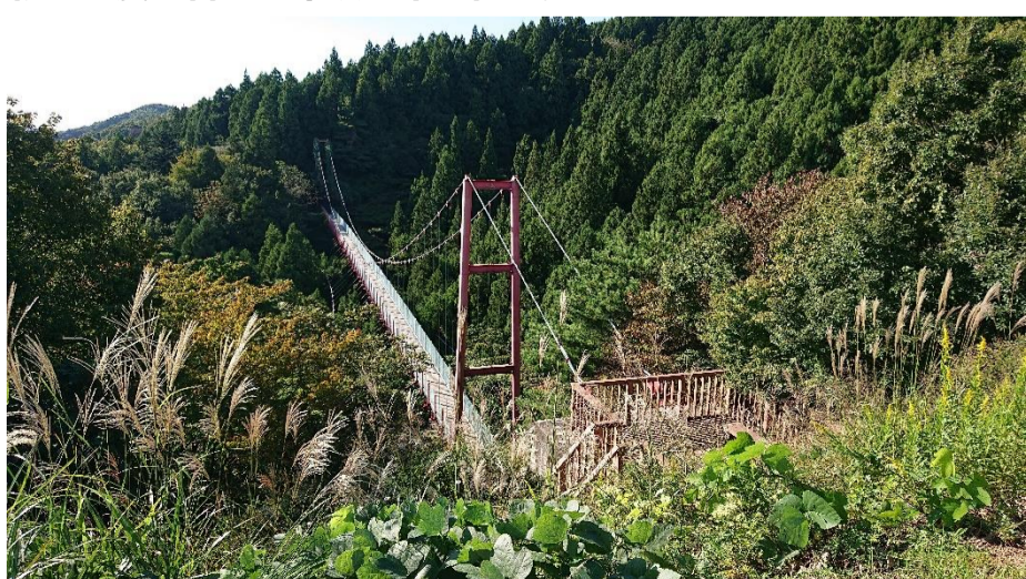
⑤朝日山展望台から千眼堂吊り橋が見えます。