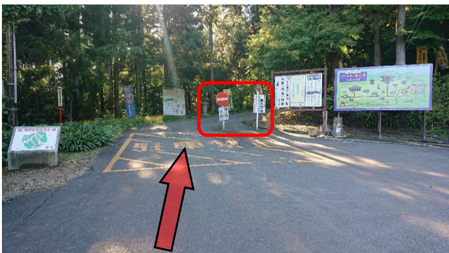
②駐車場を車両進入禁止方面に向かって進みます。