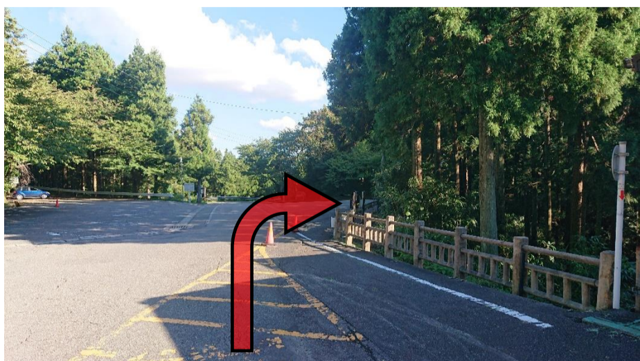
②駐車場を公衆トイレに向かって進みます。