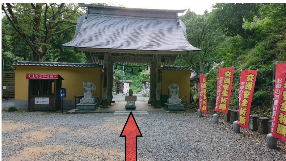
⑨再び階段を下って、右手方向に進むと山門があります。