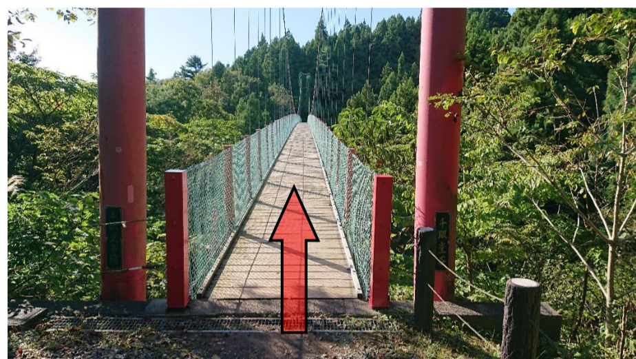
⑦千眼堂吊り橋を渡ります。