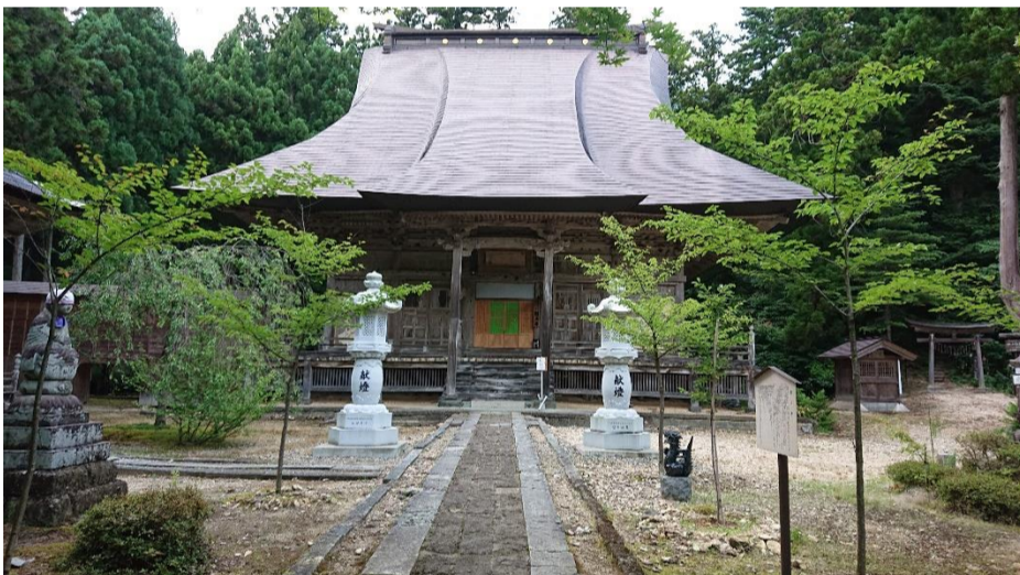
⑧国上寺本堂に到着です。