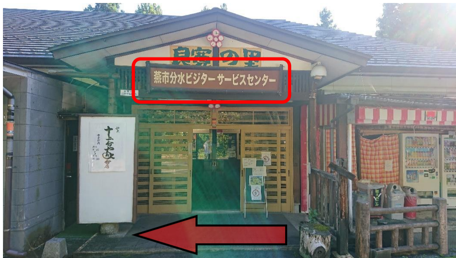
①分水ビジター・サービスセンターに向かって、左手方面に進みます。