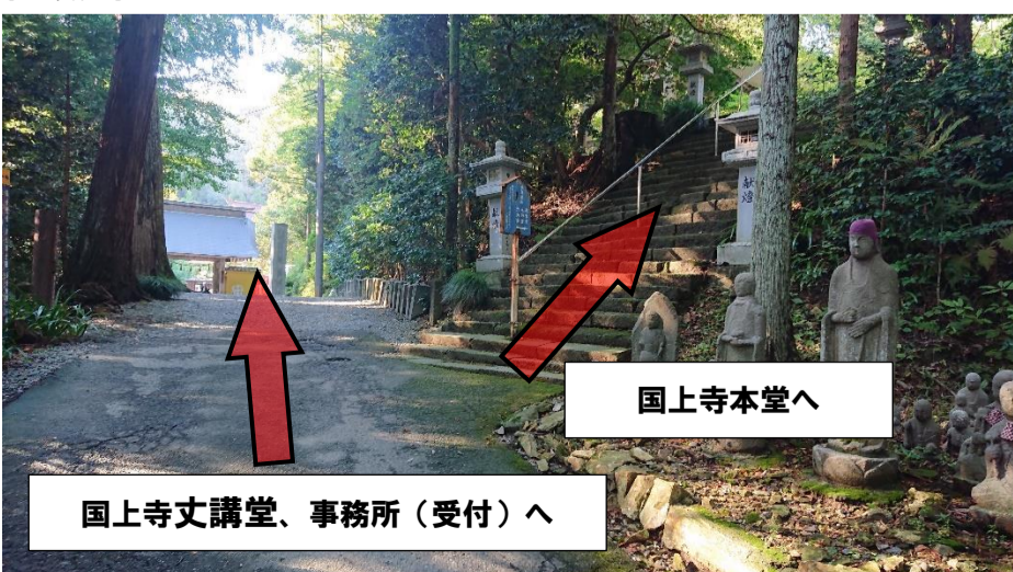
⑤階段方面に向かいます。