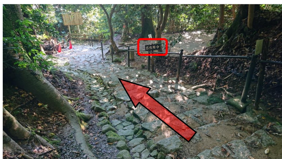
⑨石畳道階段に辿り着いたら、左手方面下る方向に進みます。