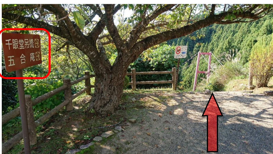
④公園内をまっすぐ奥に進み、看板に従って右手に向かいます。