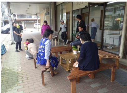
市場ブースへベンチを移動した後の様子