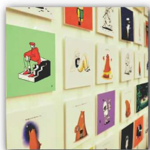
401のらくがき展 作品展示