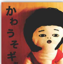
かわうそギャラリー ハンドメイド作品