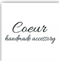
coeur ハンドメイド作品