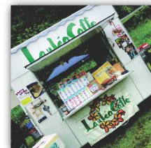
Laulea Caffe とりにくのレモン和え ドリンク、キッチンカー