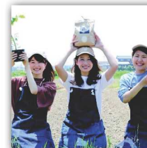
農業Crew ドリンクケータリング