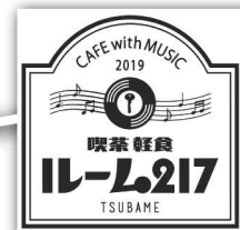
喫茶ルーム217 ランチスポット