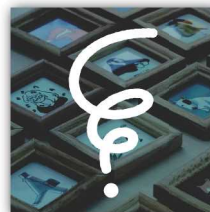
マルマド クリエイターユニット401 のセレクトショップ