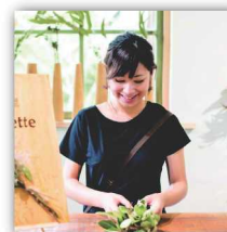
Tette 商店街に佇むドライフ ワーメインの小さな花屋