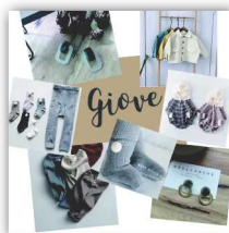
Giove ハンドメイドアクセサリ と韓国子供服