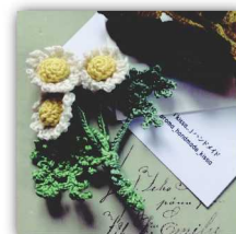
kissa.. 編み物販売、スイーツ ソープのワークショップ