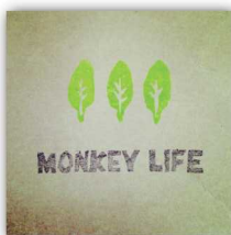
MONKEY LIFE ハンドメイドの布雑貨 子ども服・おとな服