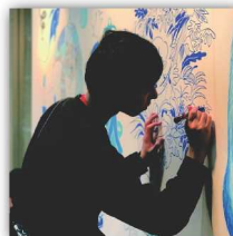
クリエイターユニット401 参加型ライブペイント インスタレーションアート