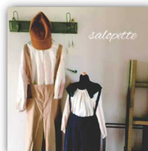
pappa ハンドメイド子ども服、 おとな服、布小物の販売