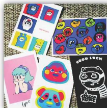
Peach Kitsch アクセサリ販売 ポストカード、似顔絵。