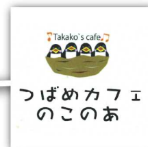
つばめカフェのこのあ ランチスポット