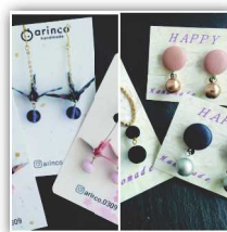
HAPPY×arinco ハンドメイドアクセサリ 布小物