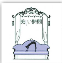
美しい時間 ランチスポット