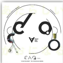
CAO。-カオ- アクリルアクセサリ