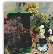
リンドラガーデン ドライフラワー、スワッグ リース、花材