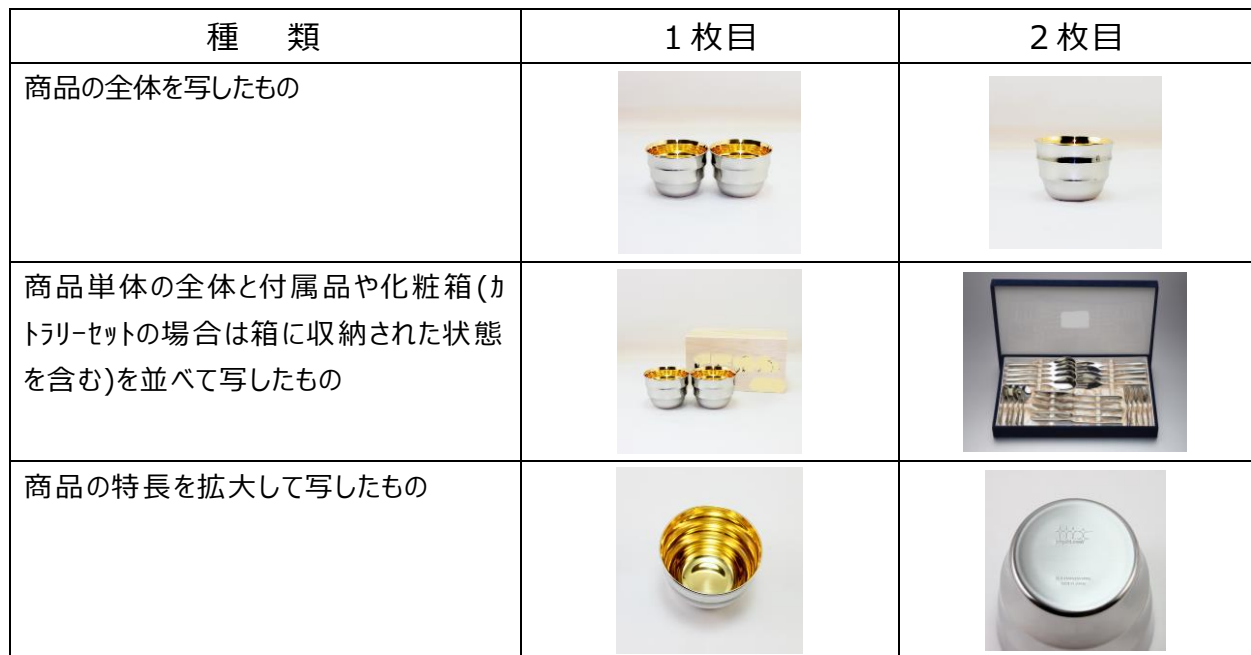
画像は地場産業振興センターのホームページなどから引用