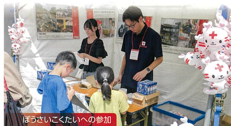
ぼうさいこくたいへの参加