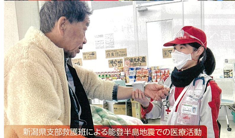
新潟県支部救護班による能登半島地震での医療活動