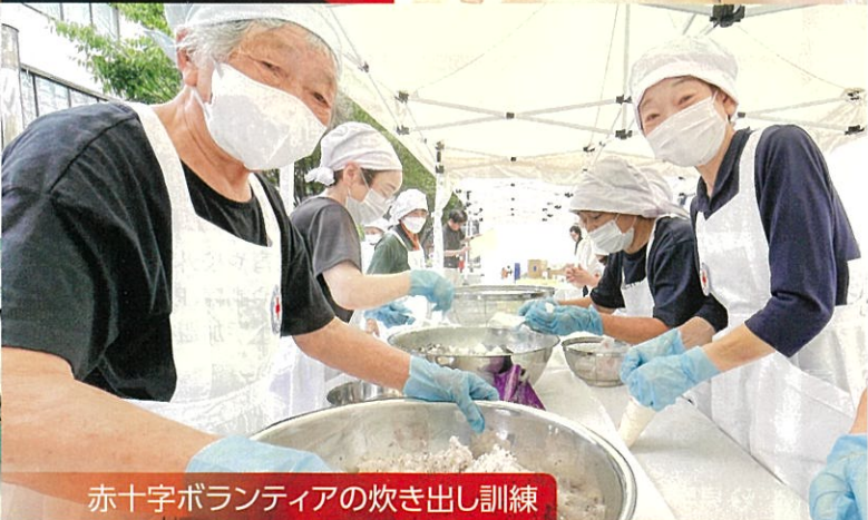
赤十字ボランティアの炊き出し訓練